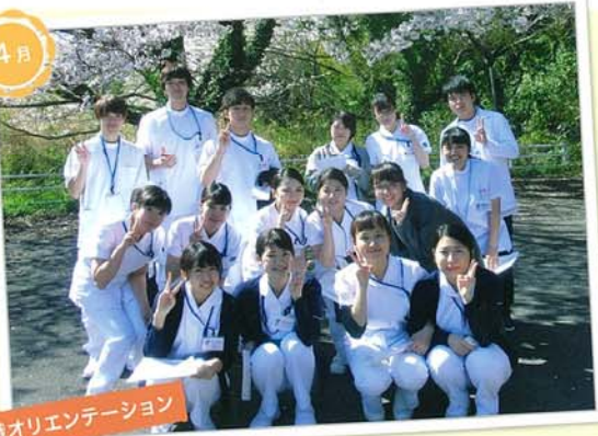
入職オリエンテーション