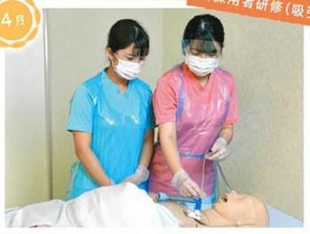
新採用者研修(吸引)

口腔内・気管内の吸引は、安楽な呼吸の援助です。技術をモデル人形で繰り返し学びます。