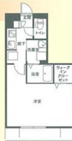
占有面積 31.26 m 2 (朝)